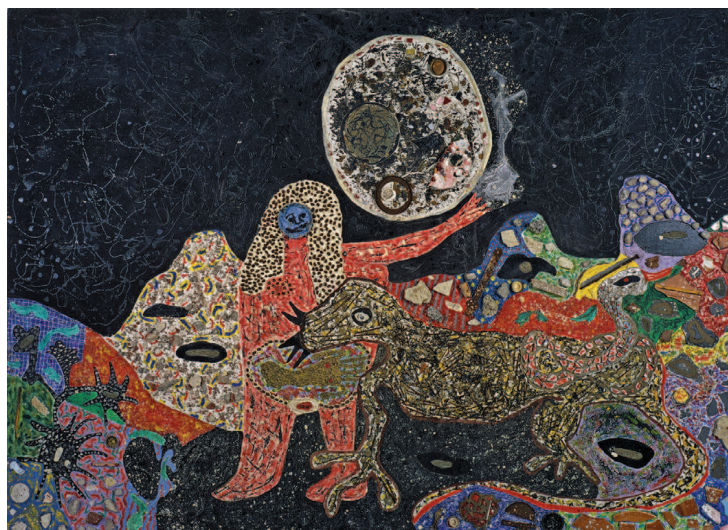
Fig. 28 / Niki de Saint Phalle. Moonlady with Dragon , 1958. Oli i objectes diversos sobre contraplacat. 150x200 cm. Donació Niki de Saint Phalle, Sprengel Museum (Hannover) ©