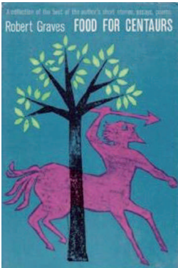
Fig 21 / Robert Graves, Food for Centaurs , Garden City: Doubleday & Co., 1960. Col·lecció particular (Palma)