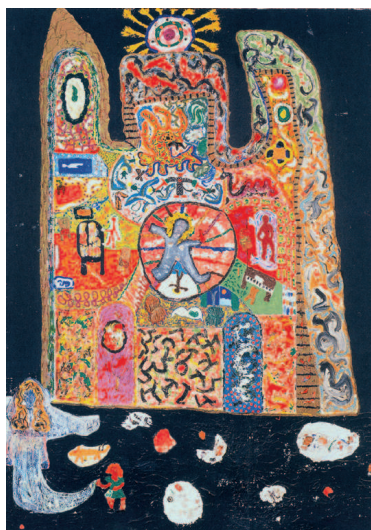
Fig. 27 / Niki de Saint Phalle. Le Château du monstre et la mariée, c.1955-1958. Oli damunt tela. 200x140 cm. Musée Tinguely (Basilea).