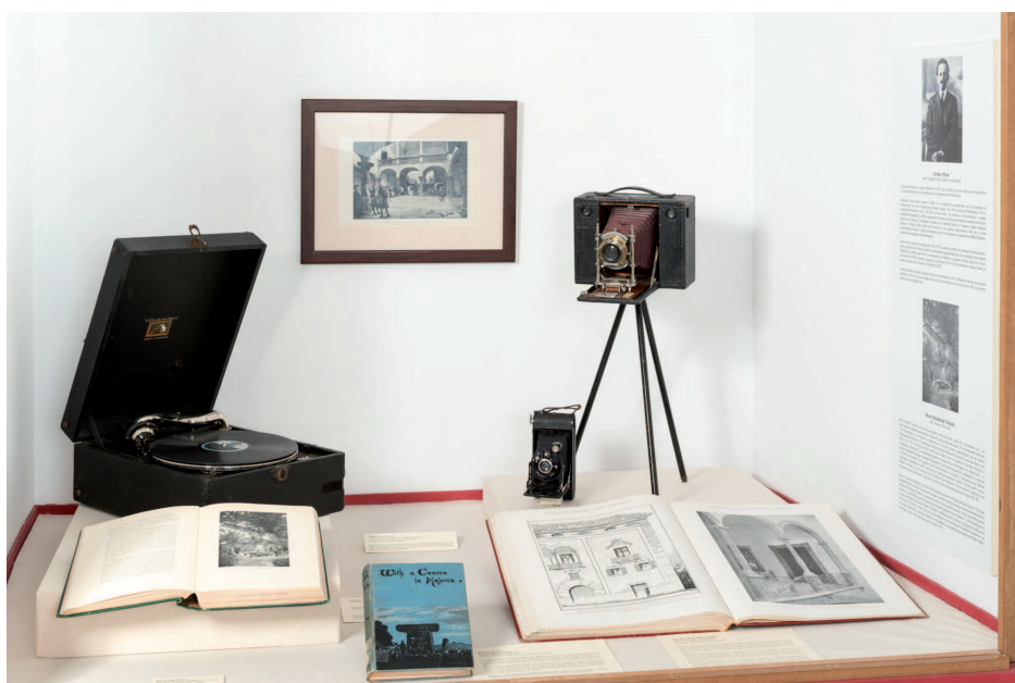
Fig. 67 / Racó dedicat als llibres de fotografies Vista general de l'exposició "La Musa i la Mar", 2015