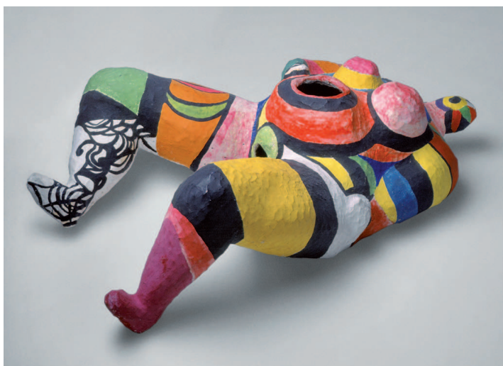
Fig. 32 / Niki de Saint Phalle. Nana Hon , 1966. Maqueta. Papier mâché pintat sobre estructura de filferro, 35x89x133 cm. Moderna Museet (Stockholm)