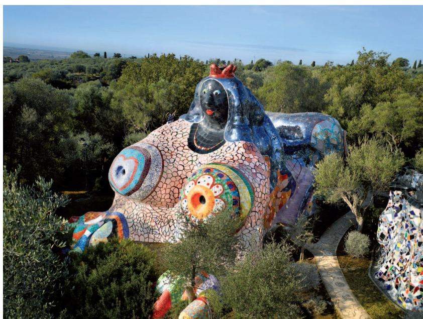
Fig. 33 / Niki de Saint Phalle. Emperatriz, 1980-1989. Giardino dei Tarocchi (Garavicchio, Italia)