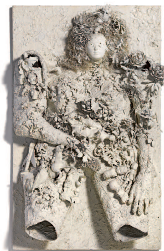
Fig. 31 / Niki de Saint Phalle. The White Goddess , 1963. Pintura, guix, llana, joguines, filferro i fusta, 178x110x38 cm. Colecció Renault © 2015 Niki Charitable Art Foundation.