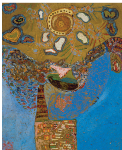
Fig. 25 / Niki de Saint Phalle. Deïà , c.1957. Oli i grans de cafè sobre contraplacat. 123x102 cm. Donacion Niki de Saint Phalle. Sprengel Museum (Hannover). © 2015 Niki Charitable Art Foundation. Foto: desconegut