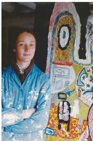
Fig. 66 Niki de Saint Phalle a Deià, c. 1957.