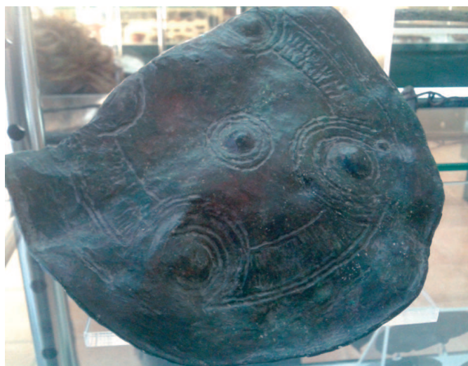
Fig. 26 / Placa de bronze amb motius geomètrics. Sa Cometa dels Morts (Sóller), Cultura Talaiòtica. Museu Monestir de Lluc.