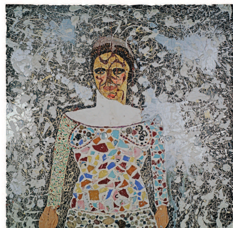
Fig. 29 / Niki de Saint Phalle. Autoportrait, c.1958-1959 Pintura i objectes diversos sobre fusta. 141x141x10 cm. Niki Charitable Foundation (Santee, CA) © 2015 Niki Charitable Art Foundation.