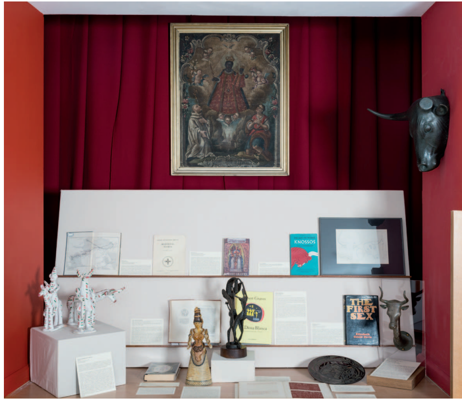
Fig. 22 / Robert Graves a l'Hort dels Tarongers Vista general de l'exposició "La Musa i la Mar", 2015