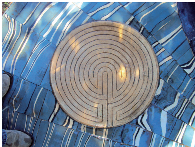
Fig. 34 / Niki de Saint Phalle. Projetto per El laberinto , 1980. Placa ceràmica. Giardino dei Tarocchi (Garavicchio, Italia) ©